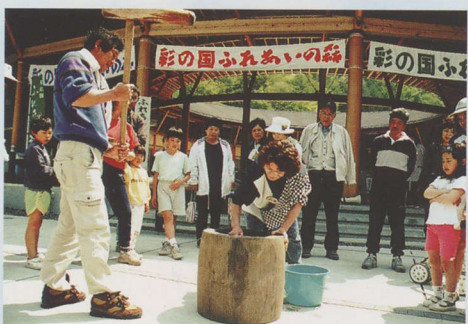
都市と山村の交流イベント（ふれあいの森：大滝村）