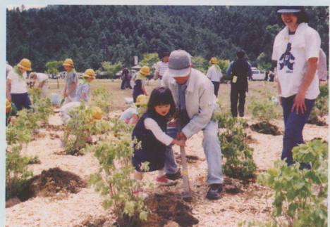
大きな木に育つことへの期待をこめた記念植樹