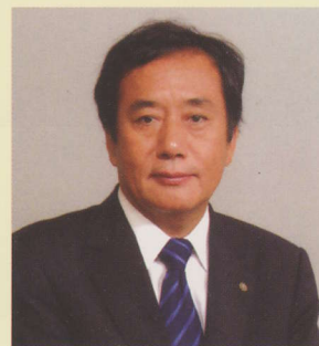
埼玉県知事 上田 清司

埼玉県には約12万3千ヘクタールの森林がありますが、木材価格の低下等により手入れが行われなくなって荒廃してきており、森林は人々の助けを求めています。