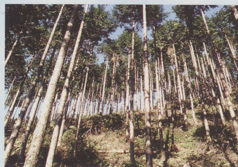
間伐・枝打ちにより生き生きとした森林