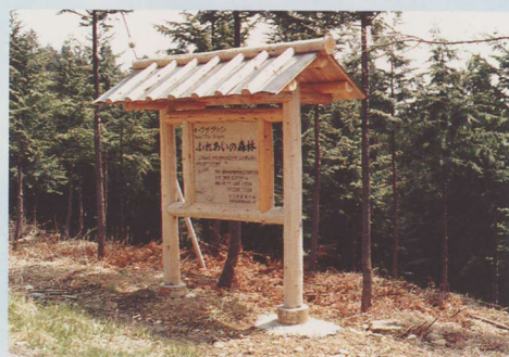
都市住民の参加による森づくりの看板を設置した森林