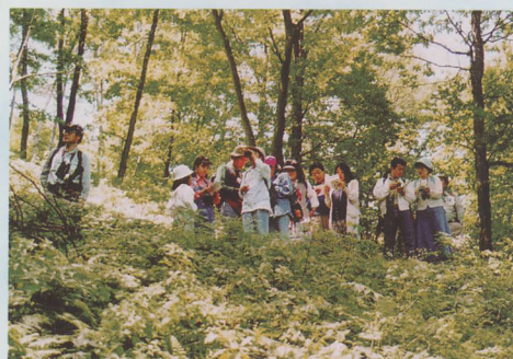
きれいな空気を吸いながら森林散策を楽しむ人々