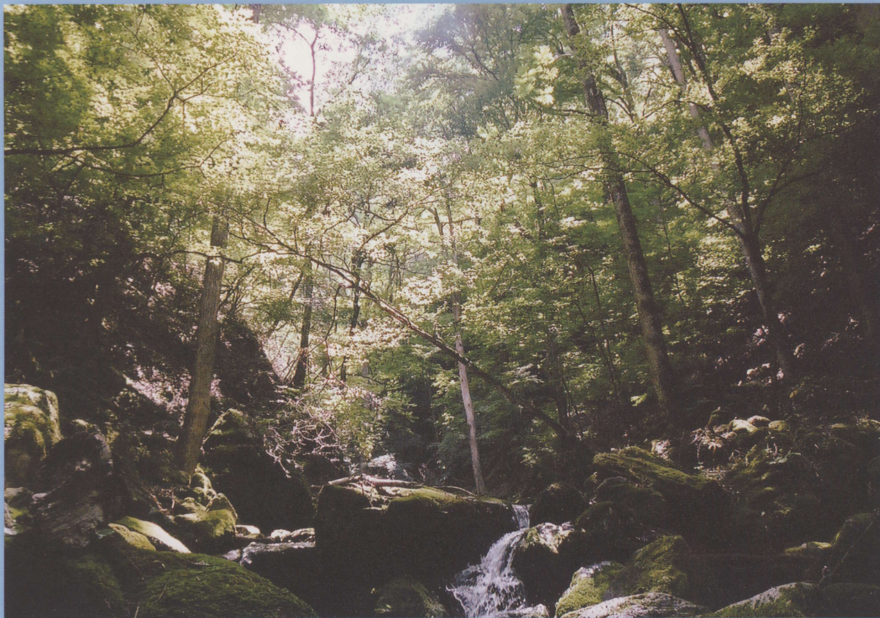
(彩の国ふれあいの森「原生の森」：大滝村)