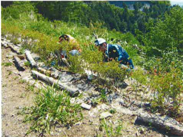
ヤマツツジの植栽