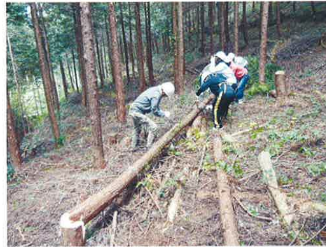
間伐木の玉切り作業