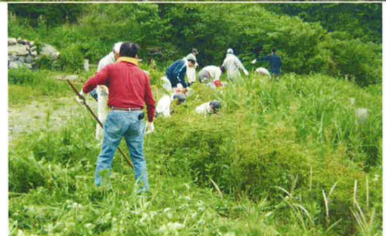
ツツジ植栽地の 下刈作業