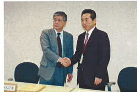
第1期協定 (H17.3.28 調印式)