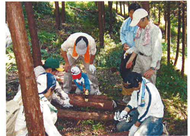
間伐したヒノキにナメコを植菌 翌年の作業時（H21.10月）に収穫