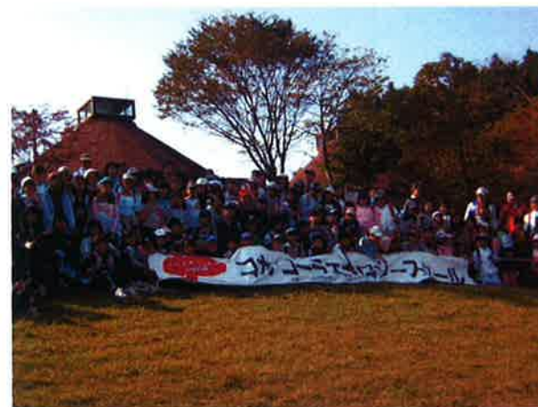
第2回森林ボランティア活動(H20.10.18)

平成28年度で「埼玉県森林づくり協定」が満了となりますが、これまで、当公社の森づくり活動に御理解・御協力いただきましたことに改めて感謝し、心よりお礼申し上げます。