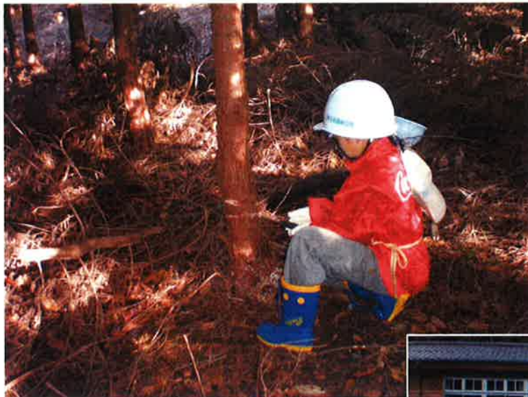
ノコギリで間伐作業

間伐・枝打(h=約 1.5m):平成 21 年 12 月 13 日（参加人数 61 名）