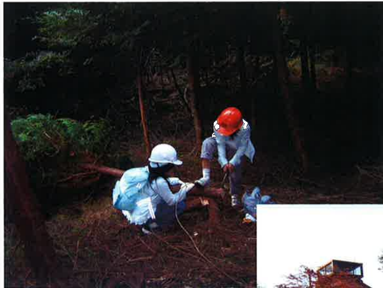
間伐作業後のコースター作り

間伐・枝打(h=約 1.5m):平成 20 年 10 月 18 日（参加人数 175 名）