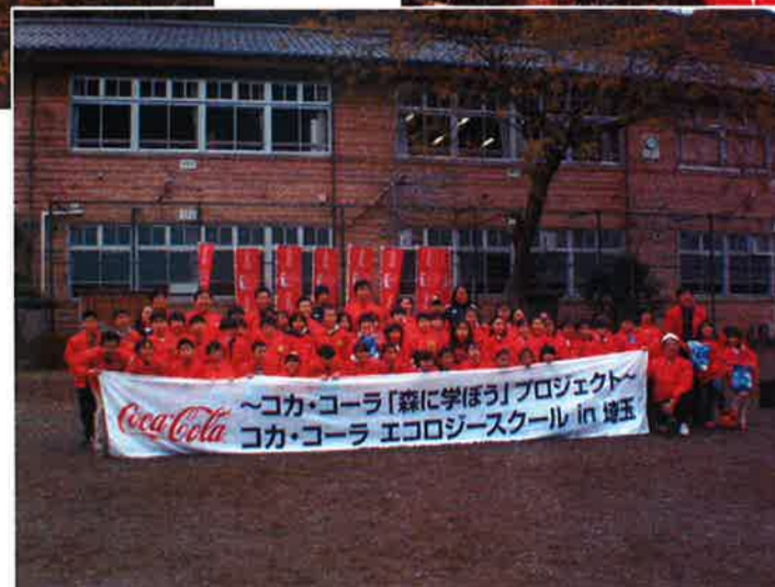
元サッカー選手との交流会