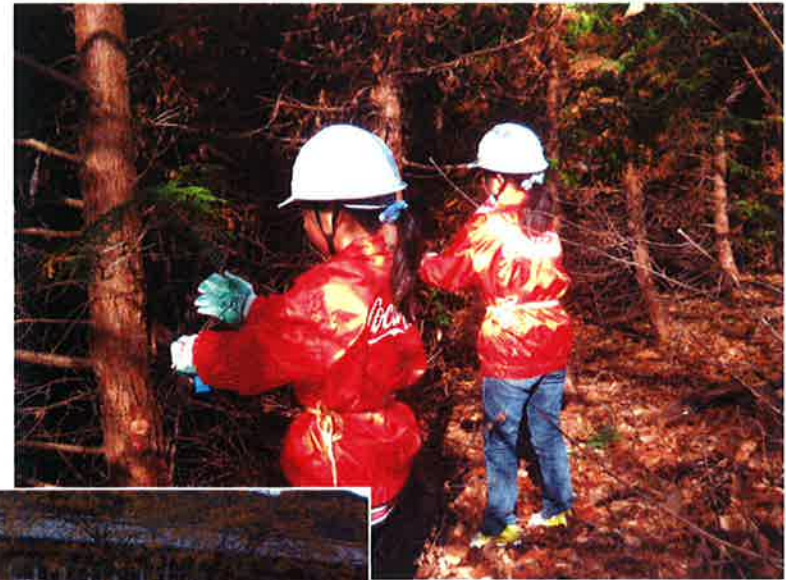
手の届く範囲までの枝打作業