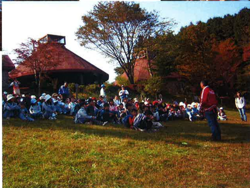
作業後の参加者(埼玉県民の森)