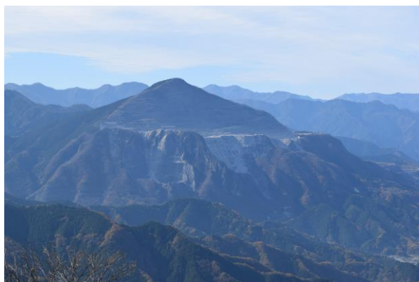
丸山山頂から武甲山

そこで皆様にも丸山山頂からの眺めを堪能していただきたく「県民の森ハイキング」を企画しました。秋の一日「県民の森」でお楽しみください。