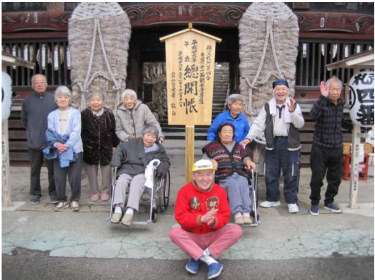
札所巡り ～札所四番 金昌寺にて～