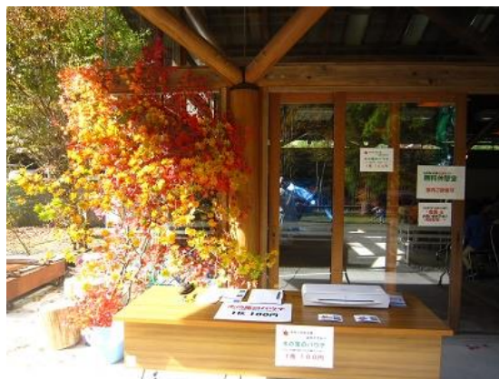
【木の葉のパウチ(もみじなど)】