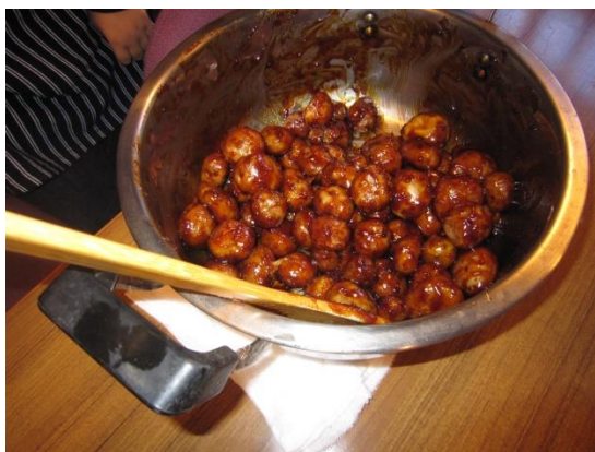
【名物：中津川いも味噌ころがし】

彩の国ふれあいの森では、春・夏・秋に季節のお祭りを開催しています。 今回は、紅葉の時期にあわせた「紅葉まつり」です。 人気のある「丸太切りや木工工作」、「木の葉のパウチ」などの体験が出来ます。 地元の農産物や、郷土食「中津川いも味噌ころがし」などの販売があります。 紅葉真っ盛りの中津川で紅葉見物とあわせて是非お立ち寄りください。 なお、事前予約は不要(体験受付は当日)。