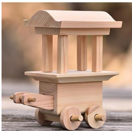
【屋台のミニチュア】