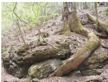
【道中観れる巨木の根とトレッキング参加者の様子】