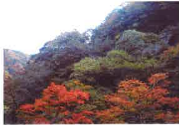
【中津川の紅葉（女郎もみじ）】