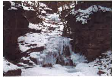
【学習の森（勤兵衛の滝）】

イベントに関するお申し込み・お問い合わせは 彩の国ふれあいの森 埼玉県森林科学館 TEL 0494-56-0026 FAX 0494-56-0028