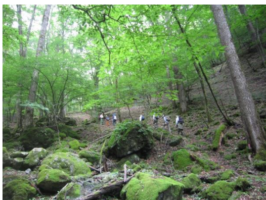
【ガイドの案内により原生林を歩く】

地元ガイドの案内により、シオジやカツラなどの大木が息づき、自然の生命力を感じられる「原生の森」の片道約2kmを歩きます。一度原生の森へ入ると、景色は一変し、まるで別世界に来たような感じがします。水は清く冷たく、沢の石は皆、苔むして緑一色です。シオジやカツラの大木の下や古倒木には小さな実生の稚樹がいっぱい生え、植物の輪廻を目の当たりにします。道中で見られる白糸の滝やシオジの群生地(平成25年3月埼玉県指定天然記念物指定)は、時を忘れてしまうほど壮観です。なお、ご参加頂いた方には、埼玉県森林科学館で作製した「木製キーホルダー」をプレゼントします。