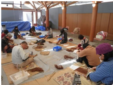
【オリジナルな「ナップザック作り」時間を忘れ集中しています。】