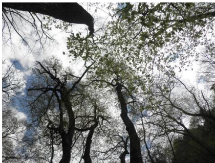
〔巨木と昨年度のトレッキング参加者の様子〕