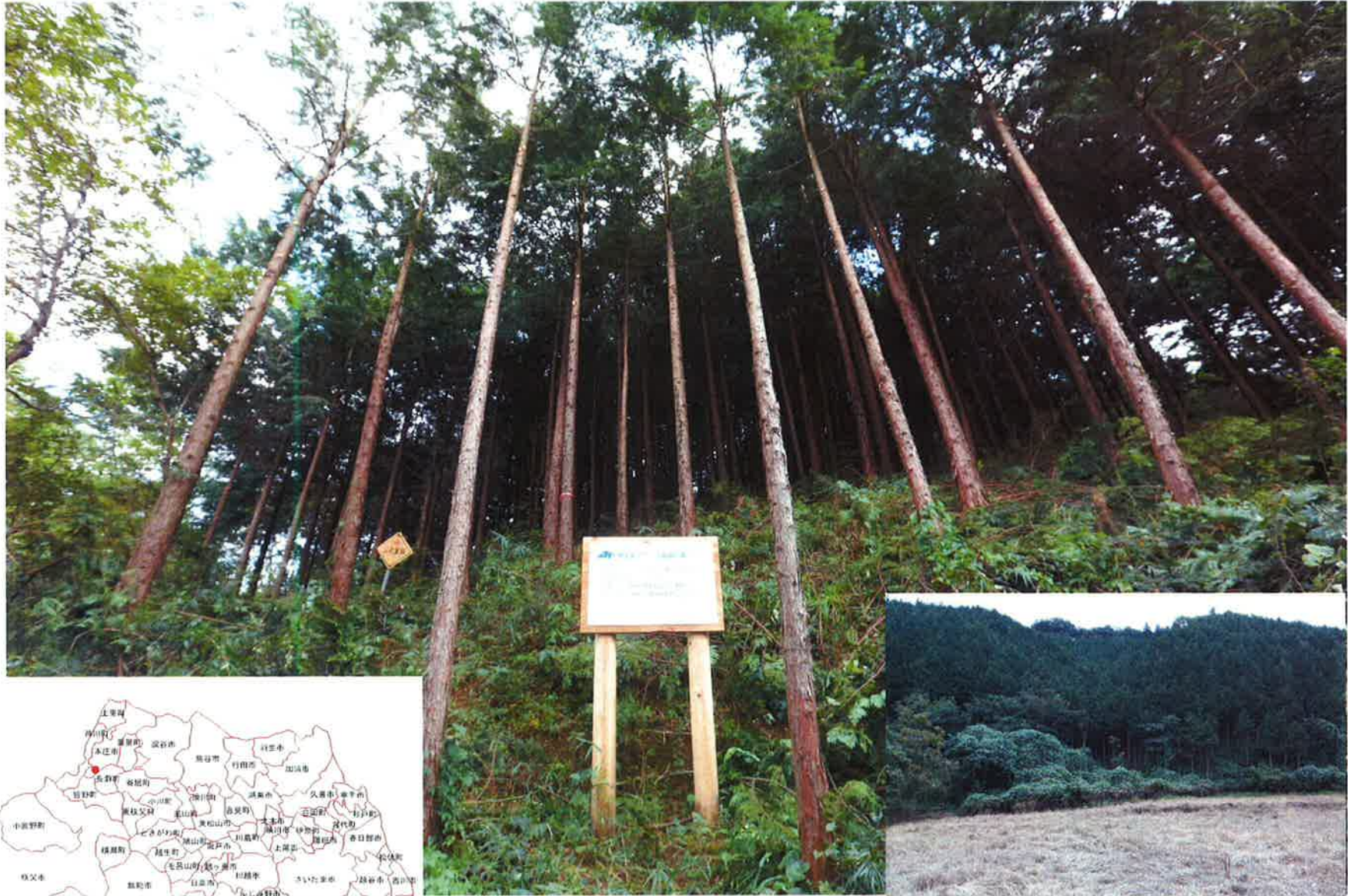
主要地方道 前橋長瀬線沿線