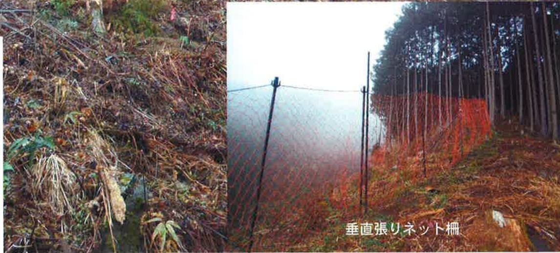
垂直張りネット柵