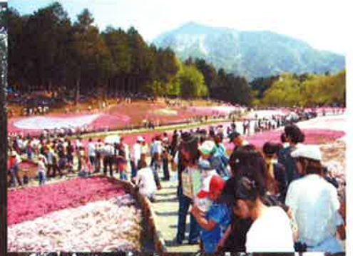
観光客で賑わう芝桜の丘