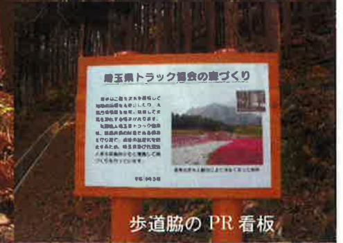
歩道協の PR 看板