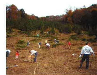
10年間の御支援の歩み