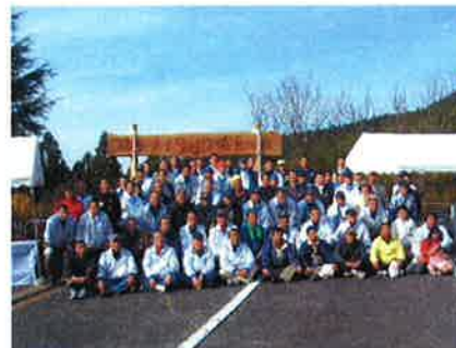
トラック協会の森づくりの出発点(H18.11.24 植樹祭)

10年の節目に当たりまして、改めて深く感謝申し上げますとともに、今後とも御指導、ご鞭撻を賜りますようお願いいたします。