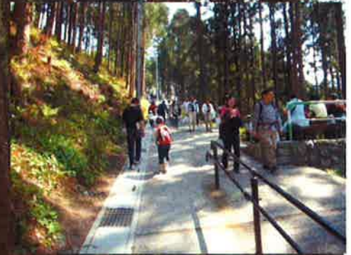
整備された中を芝桜の丘へ向う