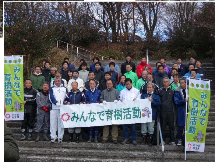
間伐作業の参加者