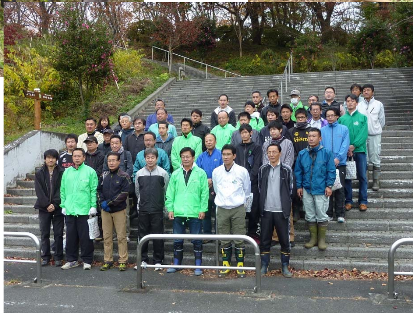
間伐作業の参加者