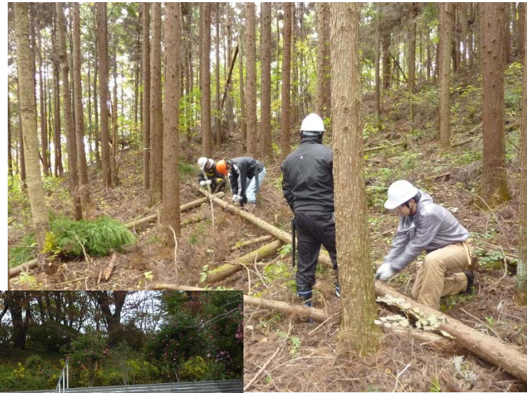
切り倒した木の片付け