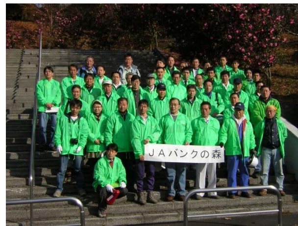
第1回JAバンクの森づくり活動(H19.12.1)

平成28年度から、新たな3箇年の協定を締結していただいた事に、改めて深く感謝申し上げますとともに、今後とも御指導、御鞭撻を賜りますようお願いいたします。