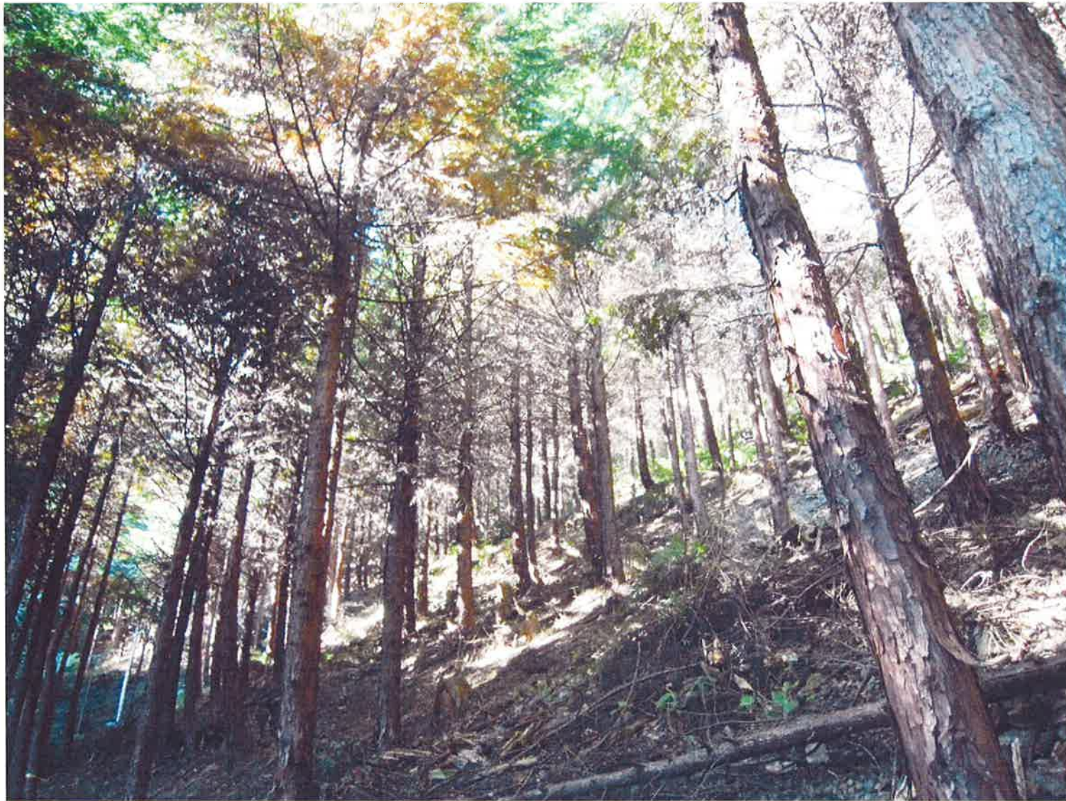
H27.11.7 枝打ちイベント作業後の状況