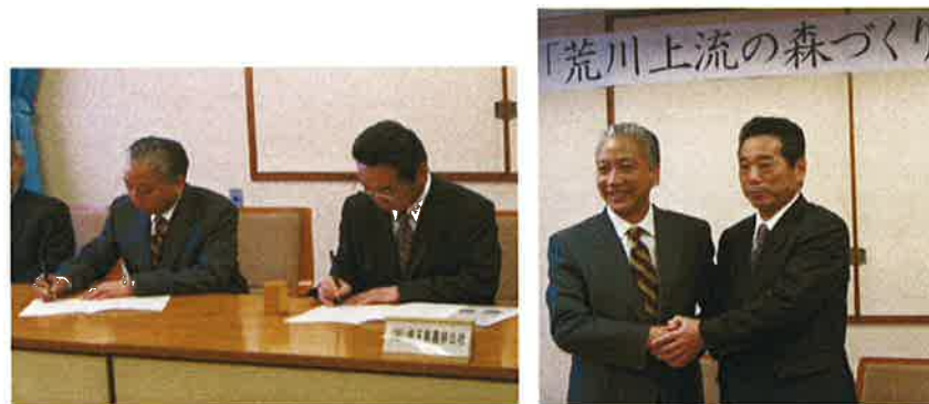
第5回 植林イベント (H19.5.26)