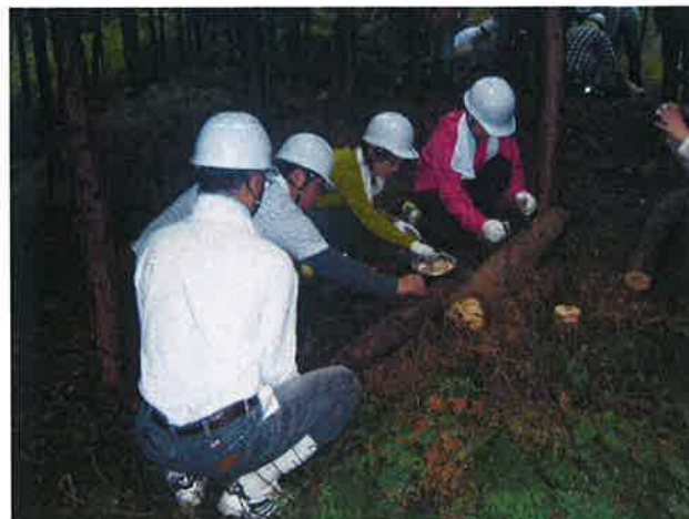
ホダギにナメコの駒打ち