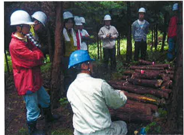
間伐材をナメコのホダギとして使用